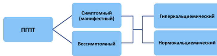
Рис.1 Классификация ПГПТ