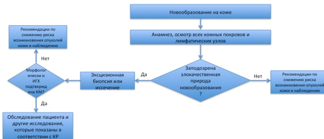
Блок-схема 1. Диагностика и лечение пациента с подозрением на опухоль кожи (КМ)