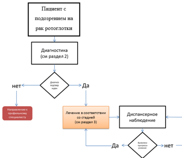
Схема 1. Блок-схема диагностики и лечения больного раком ротоглотки