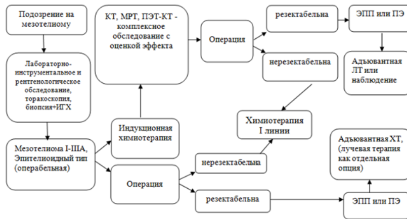
Рис. 1. Алгоритм диагностики и лечения локализованной мезотелиомы плевры