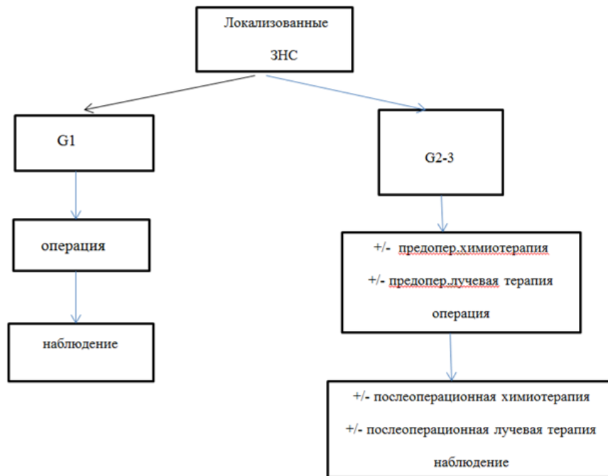
Рис. 1. Схема лечения пациентов с локализованными забрюшинными неорганными саркомами